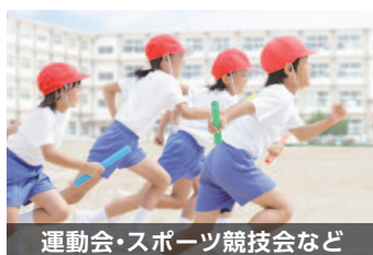
運動会・スポーツ競技会など