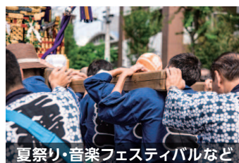
夏祭り・音楽フェスティバルなど