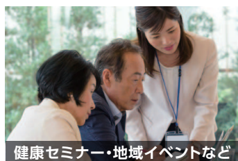
健康セミナー・地域イベントなど